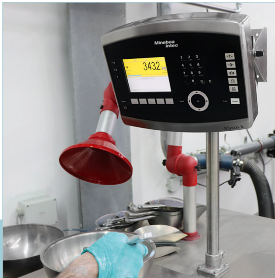
La bilancia da banco esegue una pesatura precisa di pigmenti e additivi. Un impianto di aspirazione permette un'applicazione priva di polveri

I clienti della MIXACO provengono da diversi settori. Le precise stazioni di dosaggio sono state più volte testate nell'industria chimica, farmaceutica, delle materie plastiche o dei coloranti.