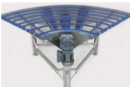
Trasportatori a curva Flex-Turn®