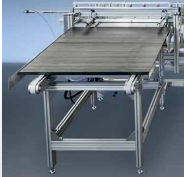
WKF 170 come fresatrice automatica per bordi con unità di avanzamento e trasportatore a rulli

Fresatrice automatica di bordi ZE 2000/2 da ASSFALG