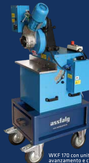
WKF 170 con unità di avanzamento e carrello