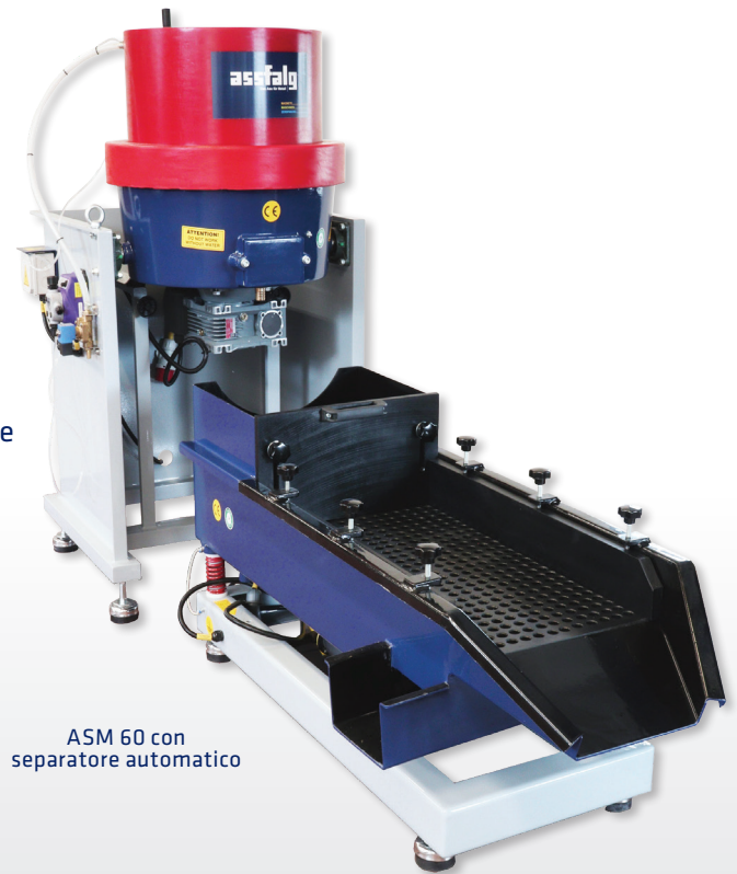
ASM 60 con separatore automatico

Gli impianti a centrifuga ASM sono ideali per pezzi molto piccoli. Grazie ad una maggiore intensità di lavorazione sbavano 10-20 volte più velocemente delle macchine di superfinitura. L'impianto a centrifuga può essere progettato come unità singola o come un sistema completamente automatico.